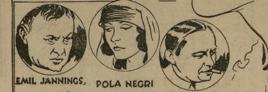
EMIL JANNINGS, DOLA NEGRI

recibió una carta de una admiradora oculta en la manga de un vestido que compró.