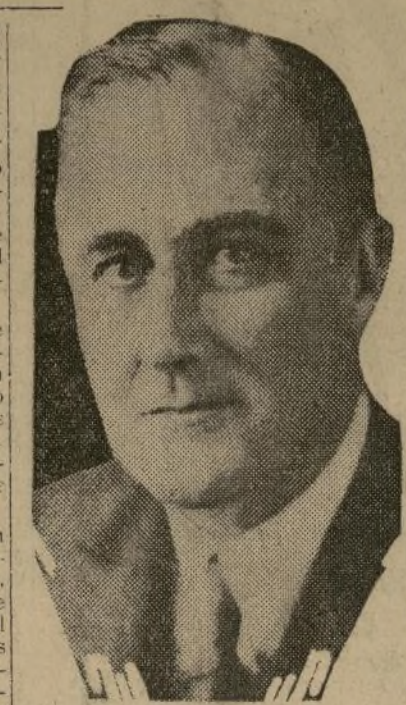
Presidente electo Roosevelt