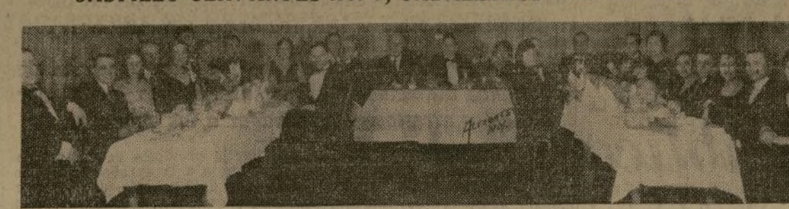
Concurrentes al banquete-baile que, para celebrar el sexto aniversario de su fundación, celebró el sábado por la noche en el Hotel Claridge de esta ciudad, asistiendo un representante de la Orden establecida en Filadelfia y una comisión de Damas del Temple Fiat Lux No. 2.