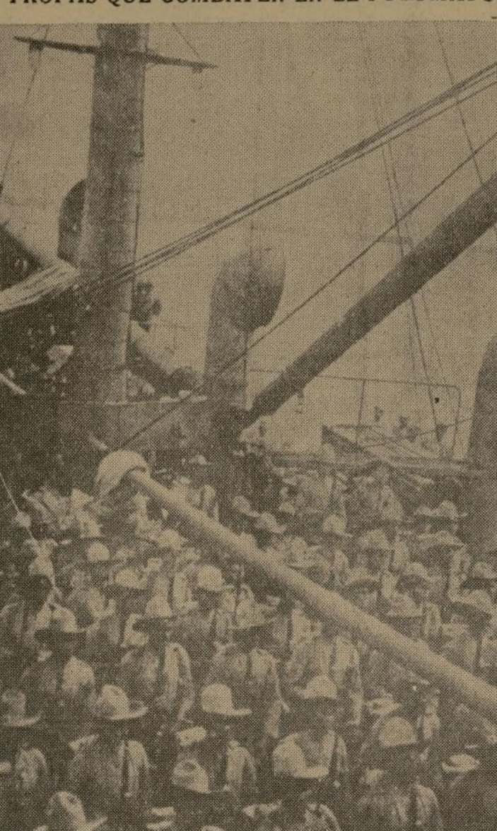
He aquí a una parte del cuerpo de infantería colombiana que navega a bordo del "Boyacá", en la región del Putumayo, durante su reciente revista por el jefe de la expedición. Estas fuerzas han entrado en acción ya en Tarapacá.