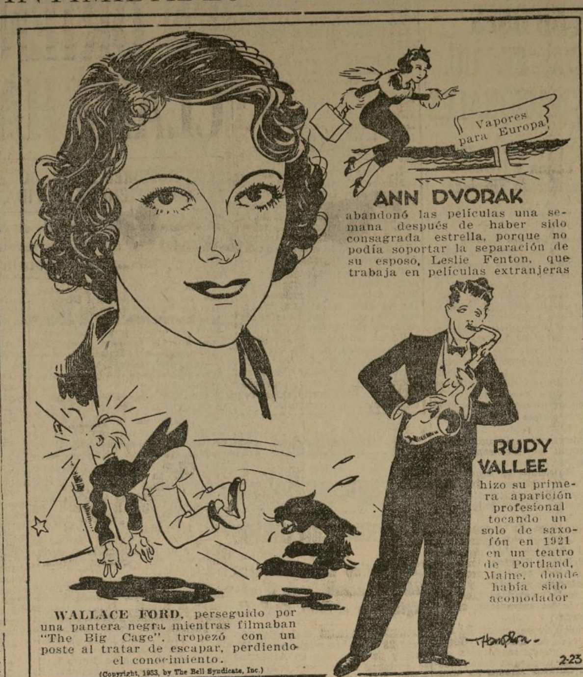
WALLACE FORD, perseguido por una pantera negra mientras filmaban "The Big Game", tropezó con un poste al tratar de escapar, perdiendo el conocimiento.