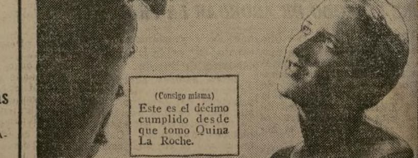
¡Caramba, cada día luces mejor!

Si Ud. desea una manera segura de hacerse más atractiva, de poner más fulgor en sus ojos y más color en sus mejillas sin el uso de cosméticos... Si Ud. quiere RECUPERAR SU SALUD, FORTALECER SUS NERVIOS, CONSEGUIR UN SUEÑO REPARADOR... tome el famoso tónico Quina La Roche, descubierto por el notable químico francés Dr. La Roche.