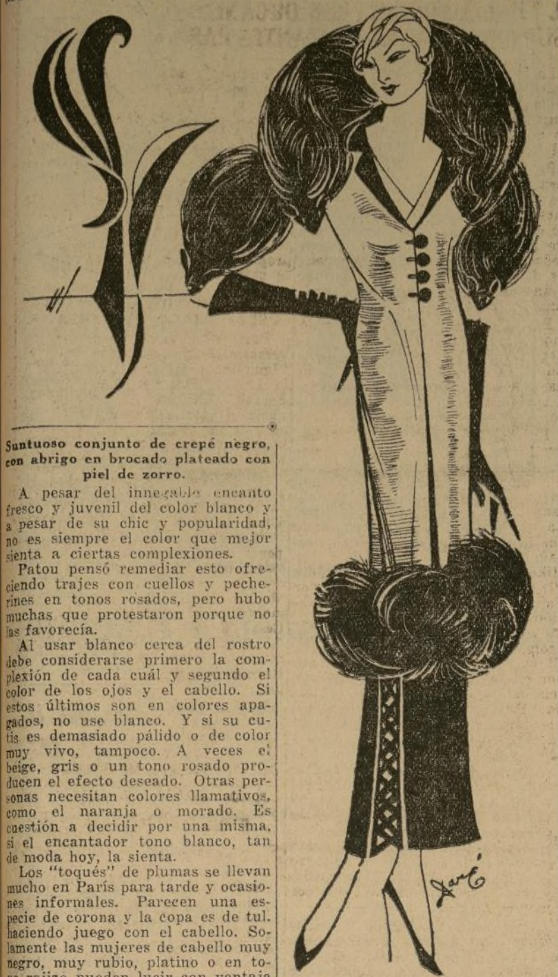
Suntuoso conjunto de crepé negro, con abrigo en brocado plateado con piel de zorro.

A pesar del innegable encanto fresco y juvenil del color blanco y a pesar de su chic y popularidad, no es siempre el color que mejor sienta a ciertas complejiones. Si estos últimos son en colores apagados, no use blanco. Y si su cutis es demasiado pálido o de color muy vivo, tampoco. A veces el beige, gris o un tono rosado producen el efecto deseado. Otras personas necesitan colores llamativos, como el naranja o morado. Es cuestión a decidir por una misma, si el encantador tono blanco, tan de moda hoy, la sienta. Los "toques" de plumas se llevan mucho en París para tarde y ocasiones informales. Parecen una especie de corona y la copa es de tul, haciendo juego con el cabello. Sonamente las mujeres de cabello muy negro, muy rubio, platino o en tono rojizo pueden lucir con ventaja estos preciosos sombreritos.