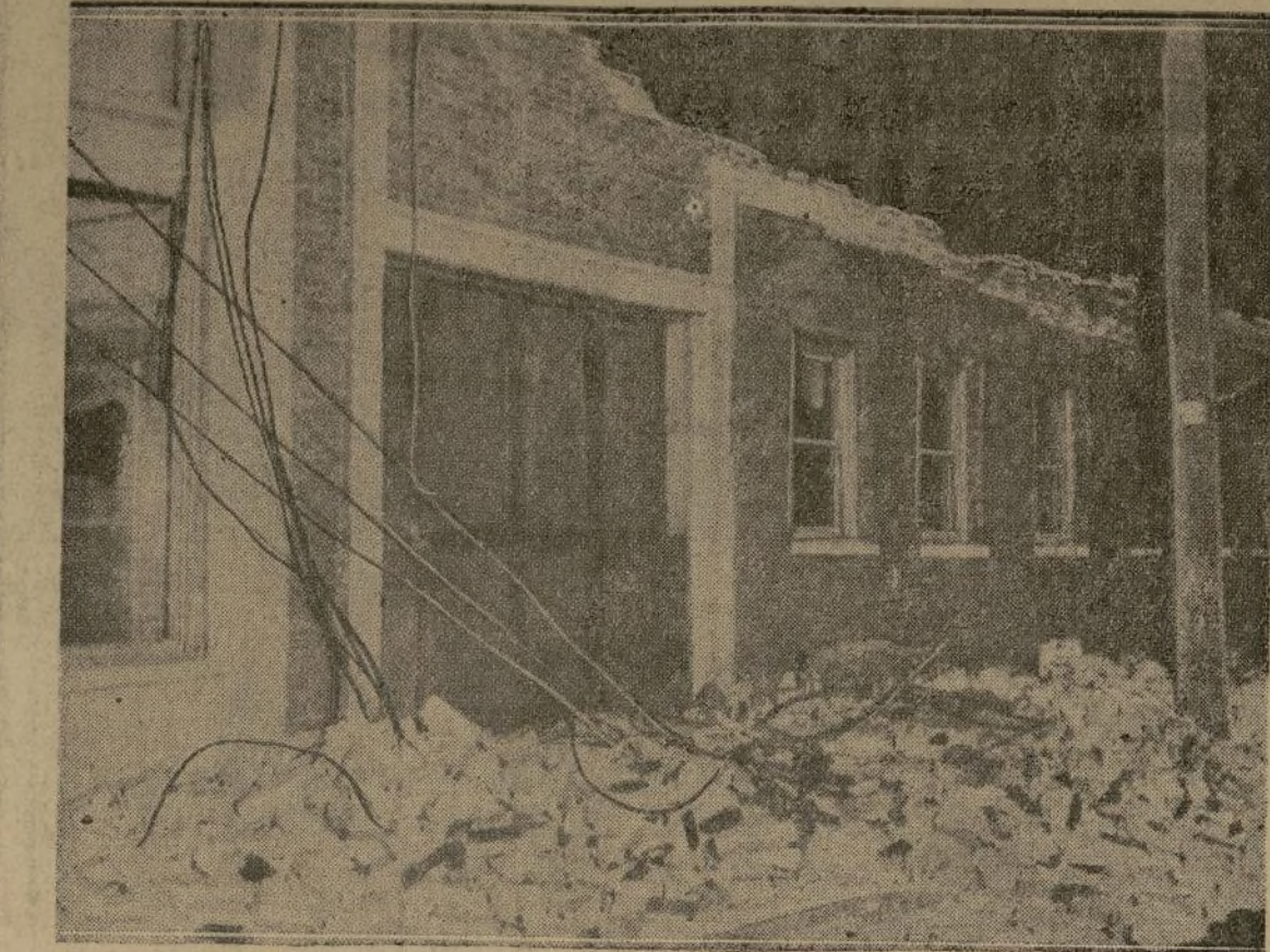
Después de escapar milagrosamente de la avalancha de ladrillos de la pared de esta casa, un hombre no identificado murió carbonizado por los alambres de alta tensión que pueden verse en la fotografía, en las avenidas Central y Slauson, Los Angeles, California.