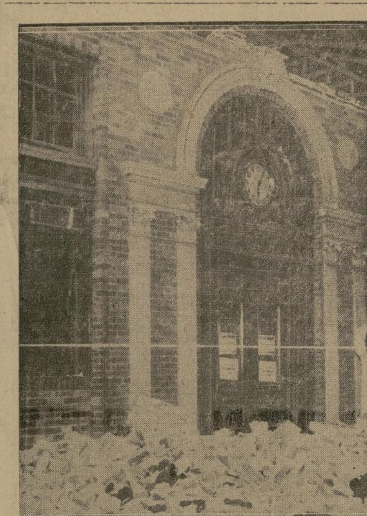
Por un capricho del destino este portal con reloj de un banco situado en las avenidas Florence y Compton, en Los Angeles, queda en pie, señalando el reloj exactamente la hora en que ocurrió la catástrofe.