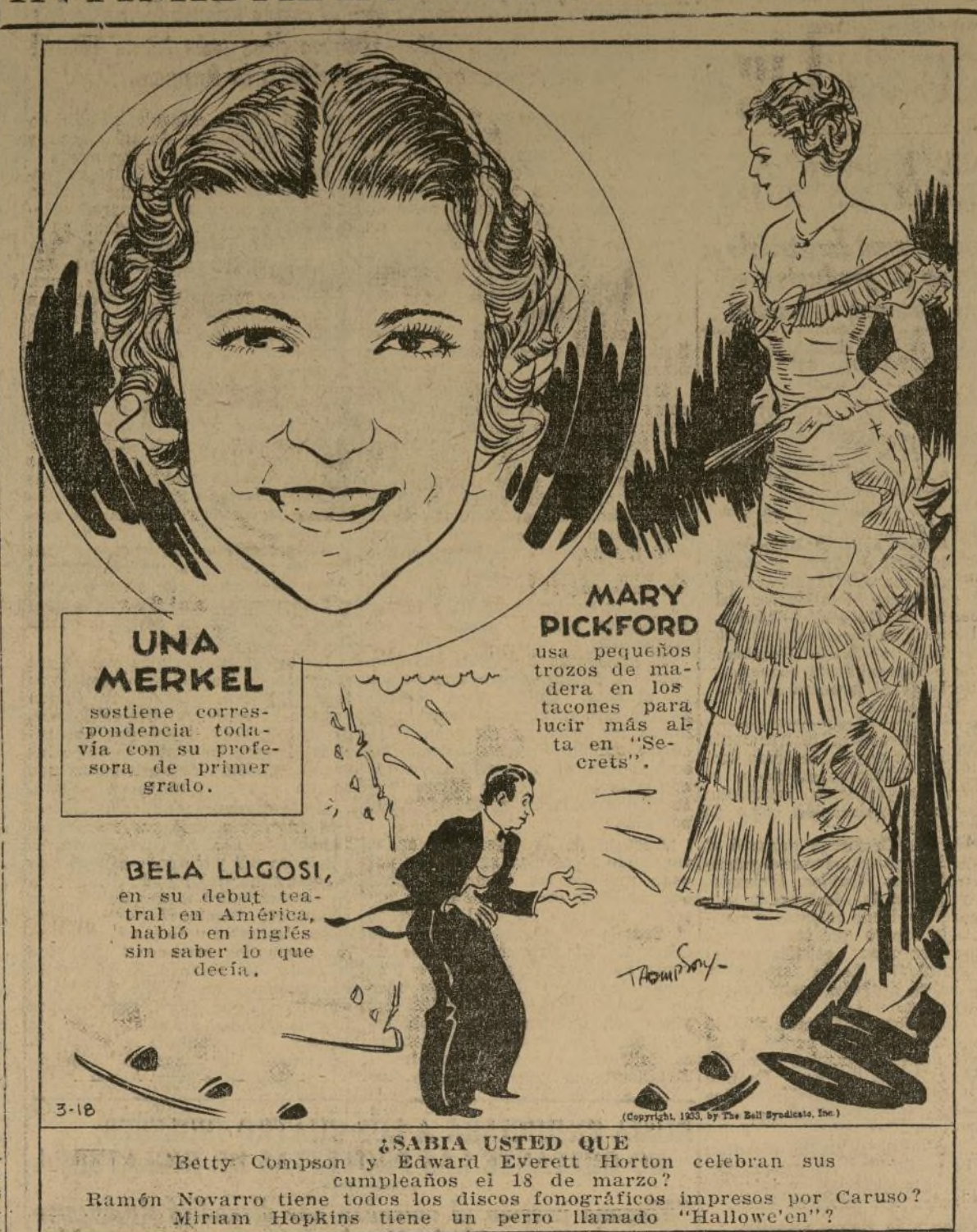
MARY PICKFORD usa pequeños trozos de madera en los tacones para lucir más alta en "Secrets".

UNA MERKEL sostiene correspondencia todavía con su profesora de primer grado.