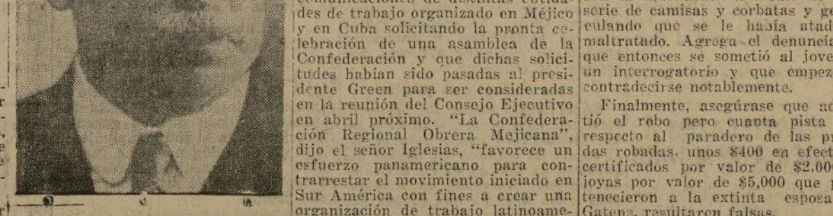
Sr. Santiago Iglesias.

"El Presidente Roosevelt le prometió al pueblo de los Estados Unidos que protegerá a las masas populares. Queremos que se nos considere parte integral de los Estados Unidos. Mi primer objetivo es aliviar las condiciones económicas de la isla."