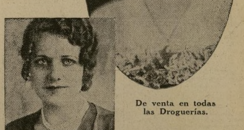
De venta en todas las Droguerías.