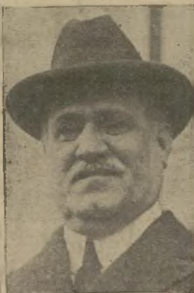
Don Antonio Barceló

Así dijo don Antonio Barceló en declaraciones sobre la situación política en Puerto Rico.—El partido liberal cooperará con Winship en todo lo que sea bueno para la isla.