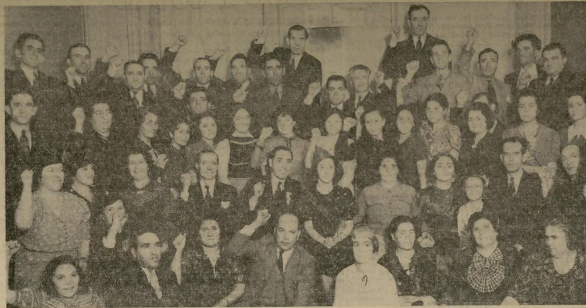
Directiva y Comité organizador del gran festival artístico-bailable que la Sociedad de Recreo y ayuda a España, Hijos de Asturias, afiliada al Comité Central Español de Secorros para la República Española, en Washington, D. C., celebrará el domingo próximo, en el Irving Plaza de esta ciudad, con el propósito de comprar una Ambulancia y medicinas, que serán enviadas al ejército leal.