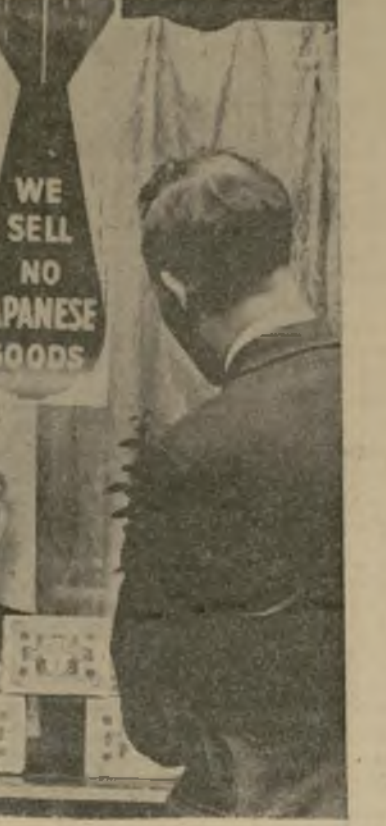
Los transeúntes se detienen a examinar un aviso en una vitrina de una cigarrería de Londres, al principio del boicoteo a los productos del Japón en protesta contra los bombardeos a los civiles en China.