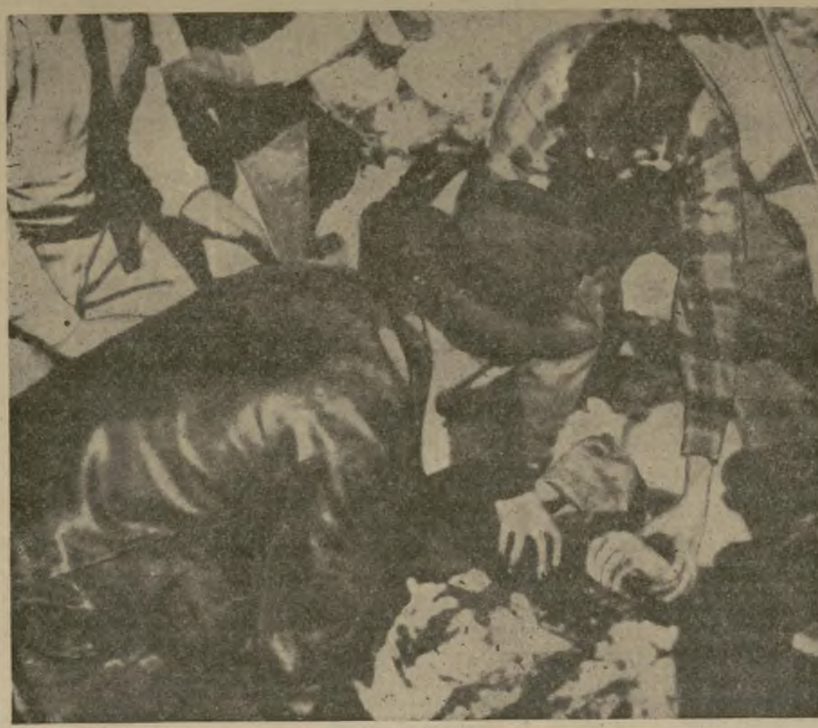
Con su cuerpo horriblemente destrozado, una de las víctimas aparece aquí en el momento de ser sacada de los escombros. Los restos de otras 18 estaban regados en la nieve en un radio de más de 100 pies.

UNA ESCENA DE LA TRAGEDIA AEREA DEL OESTE