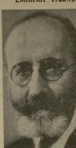
D. Ramón Menéndez Pidal

nia, a Cartago, y a Roma. El imperio romano había ejercido esta potestad suprema, extensa y completa durante seis siglos, sobre todo desde Augusto hasta Justiniano. Luego, aunque muy deficientemente, se renueva en el imperio carolingio de los siglos IX y X. Después, más achicado aún, sucede el imperio romano-germánico.