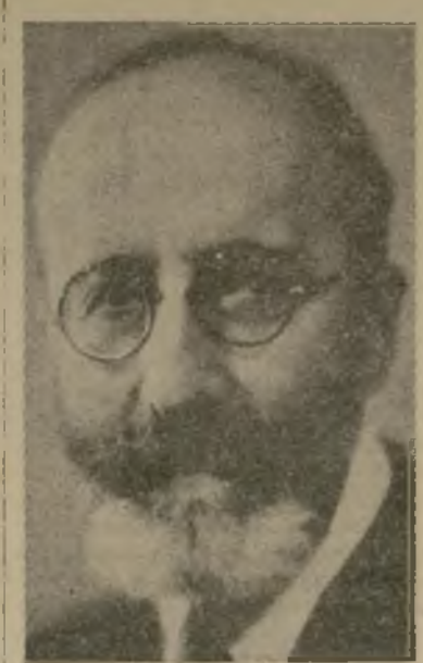
D. Ramón Menéndez Pidal

lia con doble objeto: 1o. ser allí coronado por el Papa, requisito solemne para acabar de ser perfecto emperador, 2o. tratar de persuadir al Papa la conveniencia del Concilio General que examinase la herejía de Lutero y pacificase los espíritus corrigiendo los abusos de la Iglesia.