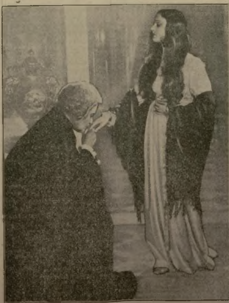
Anna Neagle y Anton Wallbrook, quienes aparecen en la película "Victor y la Gran". Esta película se refiere a la historia del reinado más largo de Inglaterra.