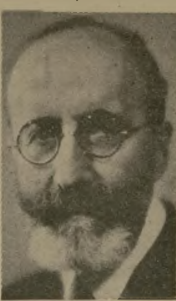
D. Ramón Menéndez Pidal

emperador universal, tuvo como tal otro carácter singularísimo: fue el primero y el único emperador europeo americano.