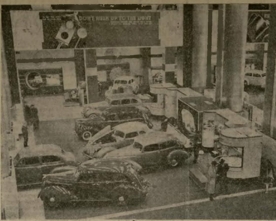
Una vista de la trigésima-octava exposición anual de automóviles en el Grand Central Palace de Nueva York la cual representa un cuadro general de la industria automovilística de la nación que espera producir 5,000,000 de vehículos durante el próximo año. La exhibición este año presenta 20 marcas de automóviles estadounidenses, 15 de trailers y 7 de vehículos comerciales.