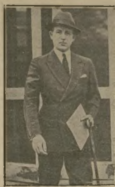
Mr. Sumner Welles

Dijo que la buena disposición de este país para renunciar a toda forma de supervisión anteriormente asumida en cualquiera república americana es bien sabida. Agregó sin embargo que hay (Sigue en la sexta página)