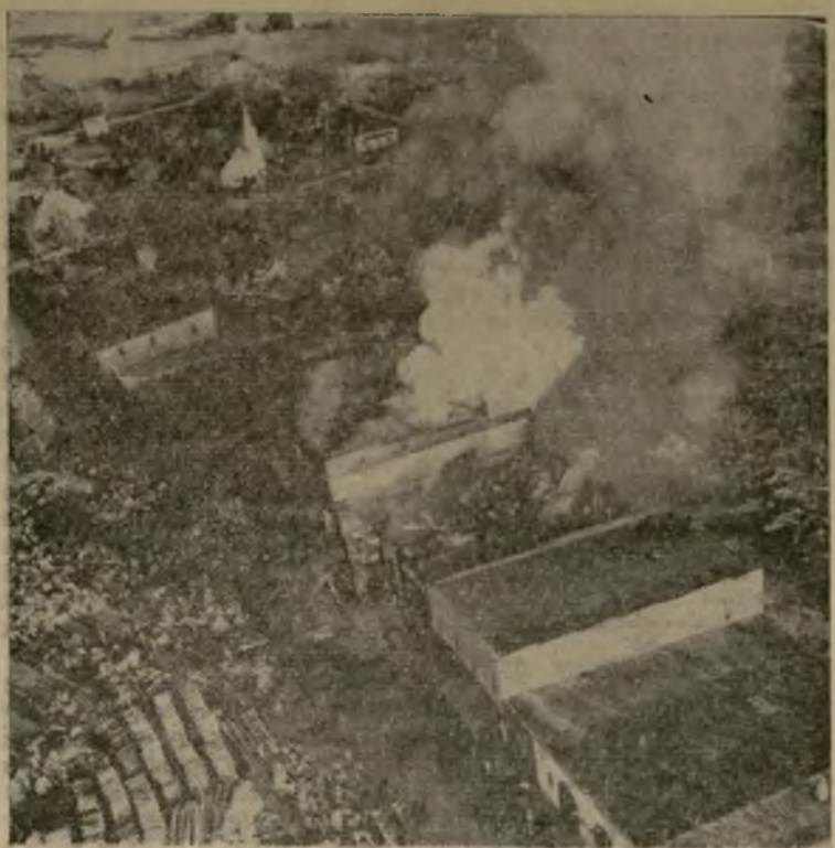
Vista aérea del fuego que destruyó doce edificios y un crédito número de hogares en Moscow, Tenn. Este incendio se declaró en una de las secciones de negocio del pueblo. La comunidad no tenía equipo para hacer frente al fuego éste que dejó muchas familias sin casa.