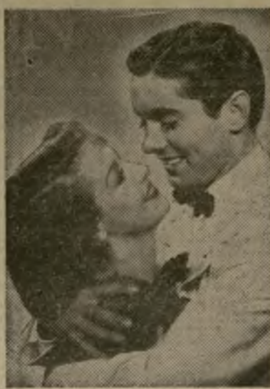
Tyrone Power y Loretta Young en una escena de amor en la película "Second Honeymoon" que presenta desde mañana viernes el referido teatro.

PROGRAMAS ANUNCIADOS PARA MAÑANA VIERNES