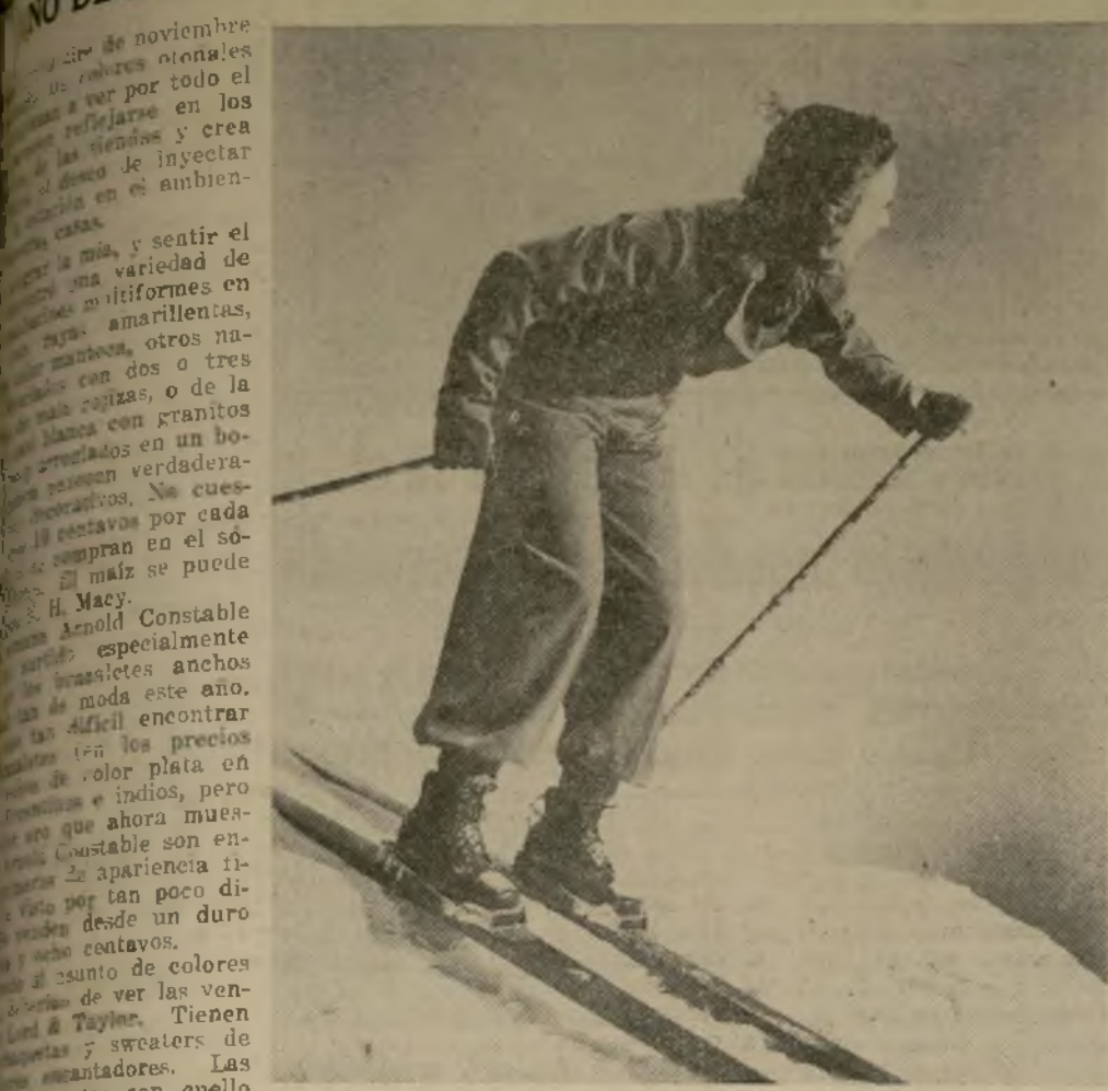
Todo de lana "gabardine" forrado con franela de lana en colores de contraste brillante. Tamaño de 12-20. Se vende en el tercer piso de R. H. Macy.

Los puede combinar los colores a gusto; comprar una pieza o tres. Comprando solo la chaqueta y la falda tendrá un traje monísimo por doce duros y noventa centavos, eso es si puede resistir un sweater pero eso será más difícil.