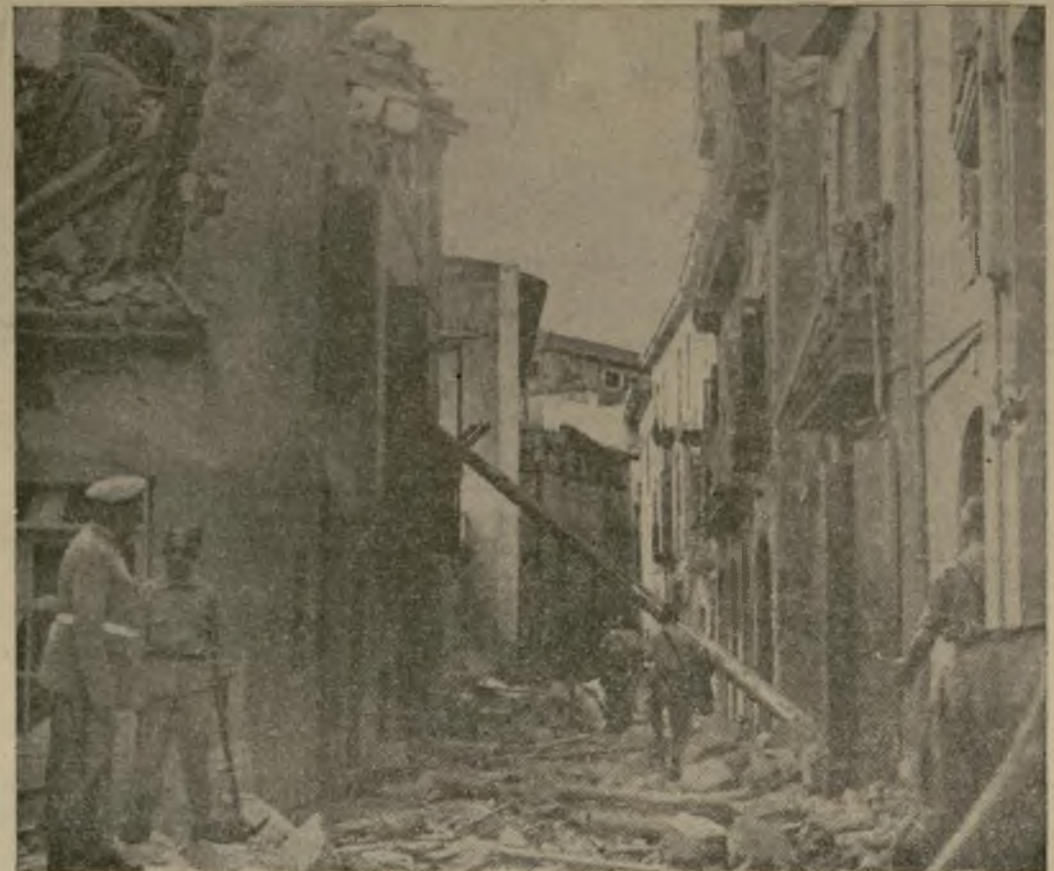
Casas en ruinas en una calle de Palma de Mallorca, después de un ataque de la aviación leal. Mallorca es una base naval y aérea de los insurgentes y de sus aliados italianos y alemanes que tienen unos 100 aviones allí.