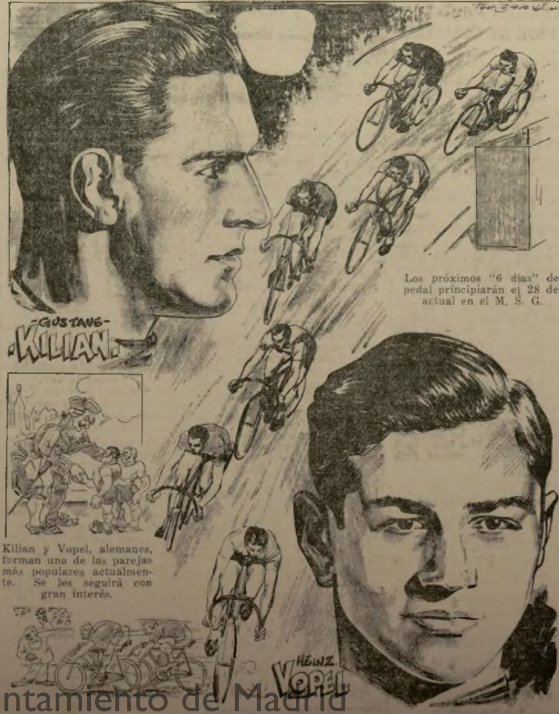
Los próximos "6 días" del pedal principiarán el 28 del actual en el M. S. G.