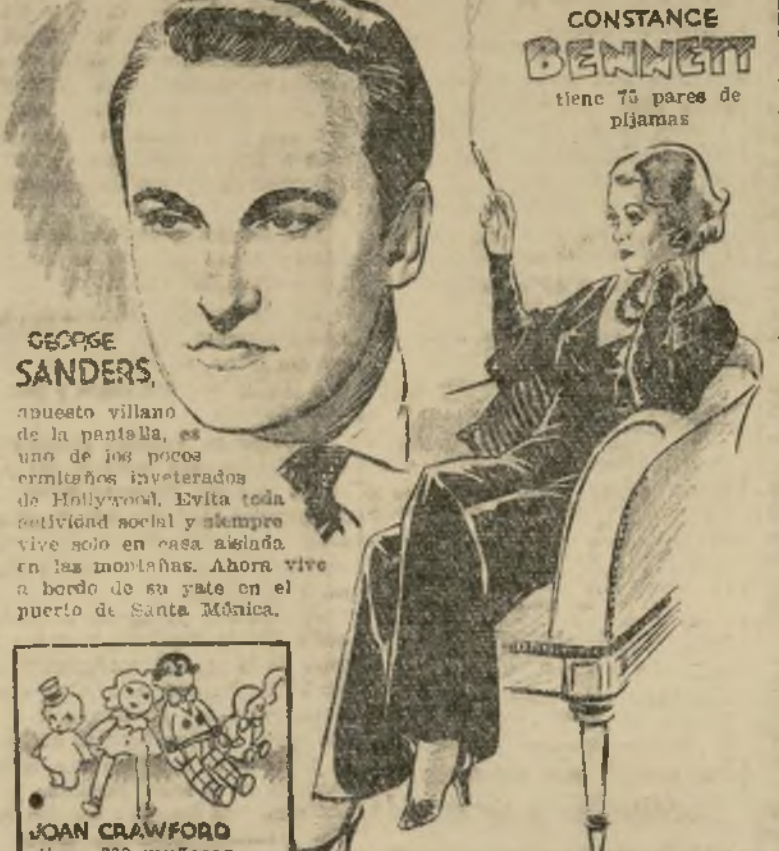
JOAN CRAWFORD tiene 399 muñecas.

PLYMOUTH, Inglaterra, noviembre 25 (AP).—El crucero británico "Apollo" llegó hoy a este puerto procedente de Bermuda trayendo a bordo el cadáver del ex primer ministro inglés Ramsay MacDonald, quien murió el 9 del presente mes cuando iba rumbo a la América del Sur a bordo del "Roma del Pacífico".