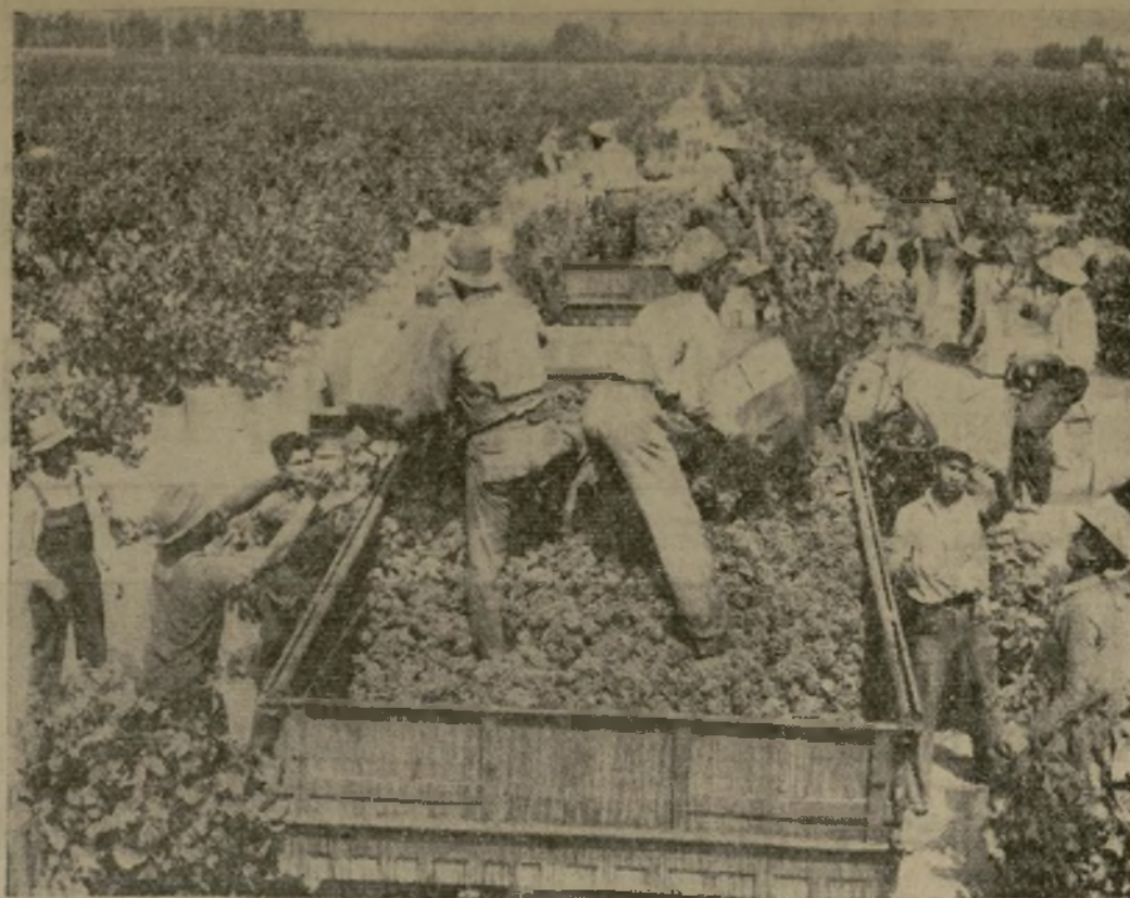
Una escena de cosecha en los Guasti Fields del Sur de California, viñedo que suministra uvas para la fábrica de vinos más grande del Estado y da empleo a más de 600 hombres durante la temporada. Los cosecheros de California se preparan a producir 70,000,000 de galones este año, ocho millones más que el promedio anual entre 1909 a 1913.