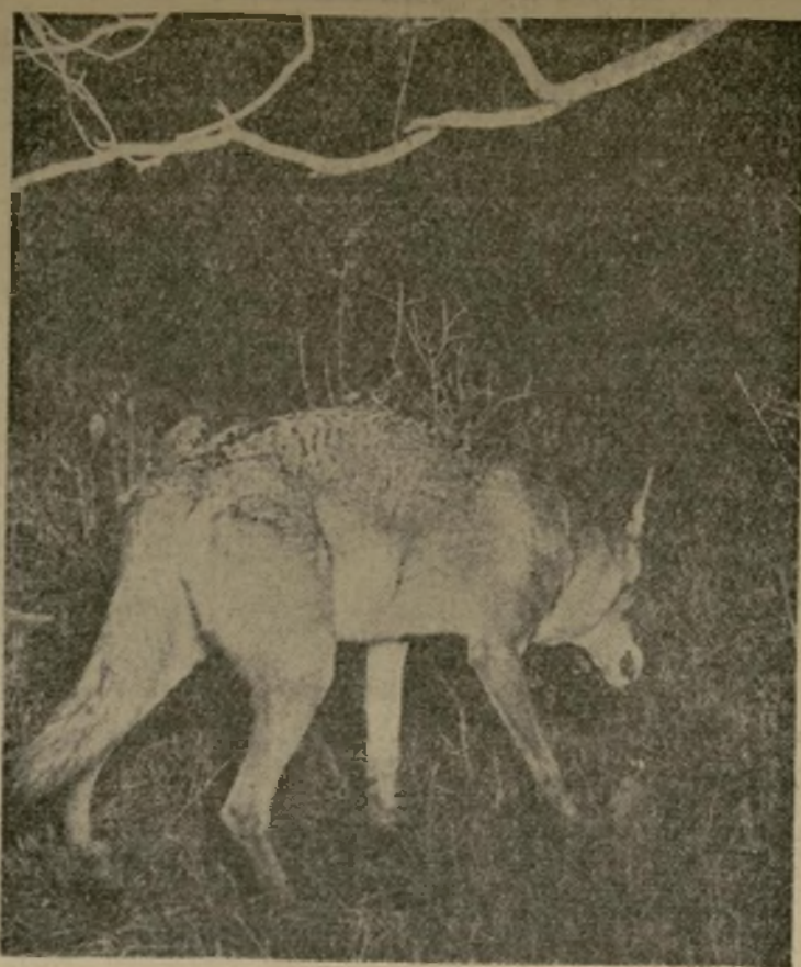
Fotografía tomada cuando el Lobo, atraído por una carnada puesta por los participantes en la caza de lobos anual del Sur de Texas en la región de Camblerton, tocó una trampa e hizo funcionar la luz y la cámara que estaban ocultas entre las ramas.