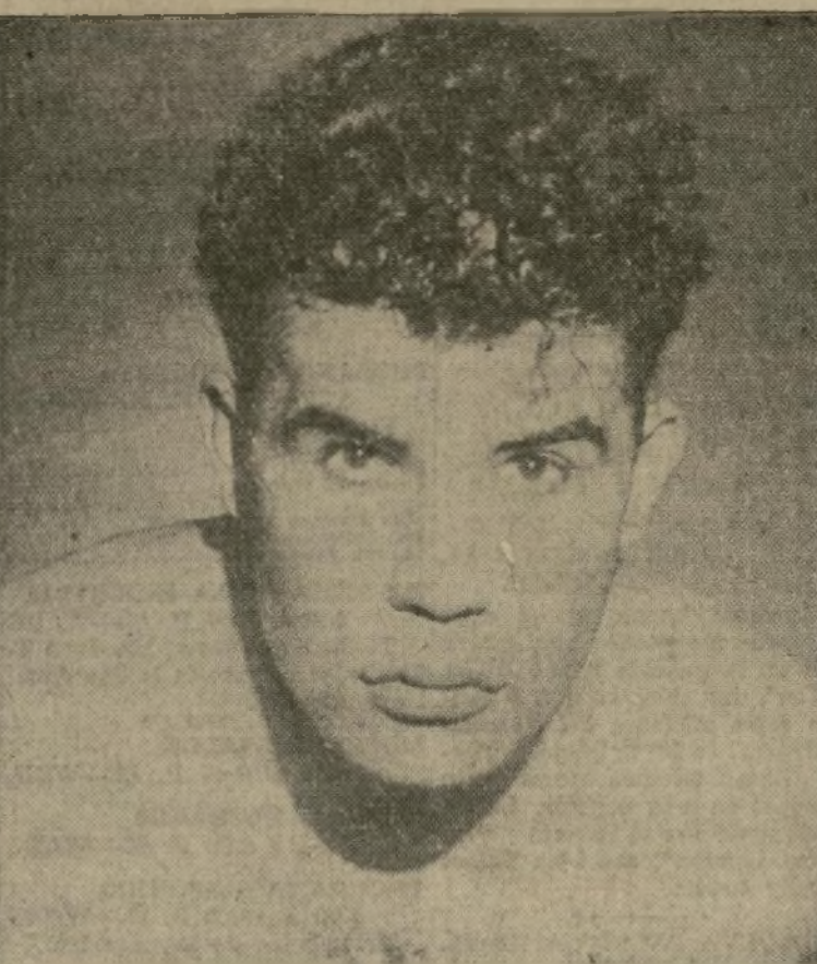
Juanito Olaguibel, el formidable luchador español, quien esta noche volverá al "ring" del St. Nicholas Palace.