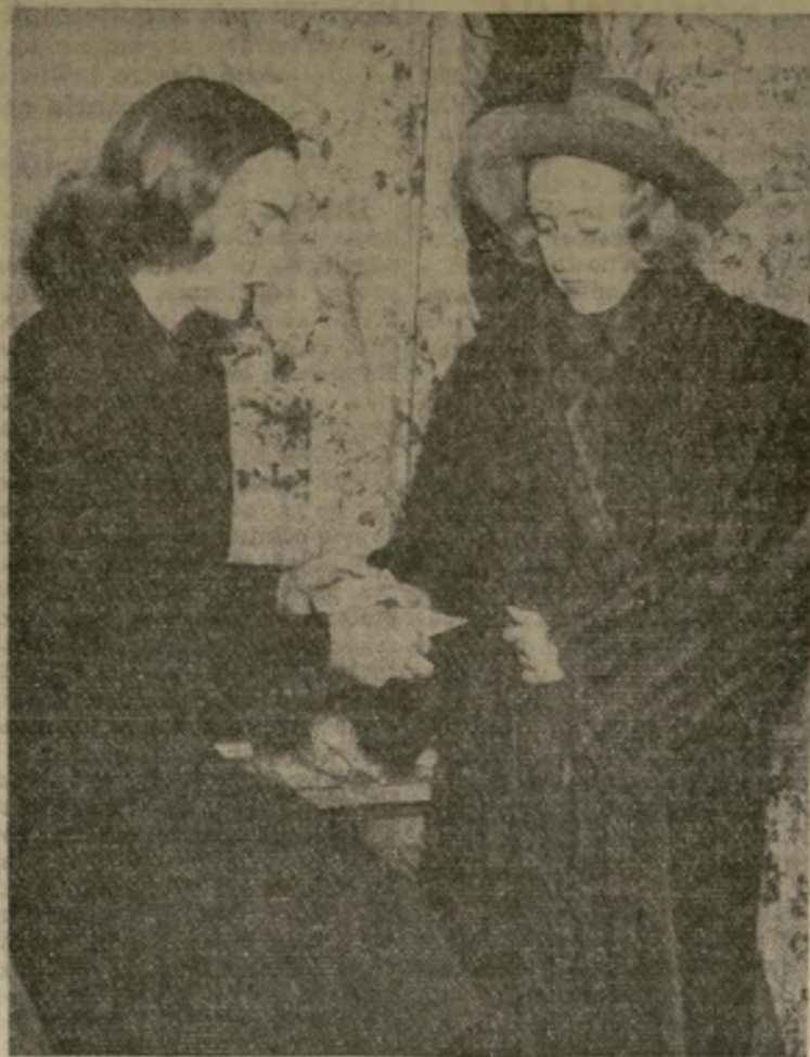
Comprando billetes para la fiesta de noche vieja del Women's Committee del Medical Bureau to Aid Spanish Democracy.