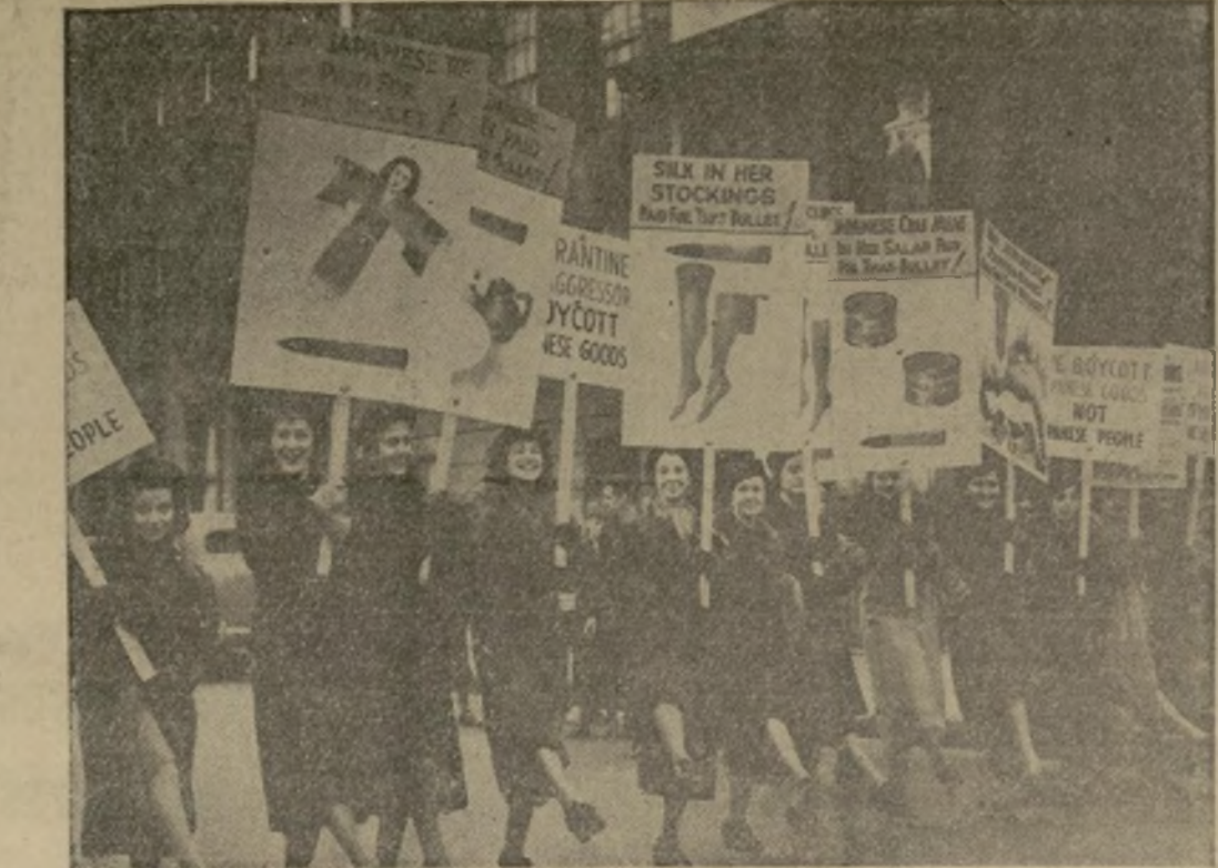
En un esfuerzo para inducir a otras mujeres de Nueva York a que no usen medias hechas de seda japonesa, un grupo de simpatizantes con los chinos en el actual conflicto del Lejano Oriente, marchó por las calles de la parte comercial de la ciudad usando medias que no son de seda y llevando cartelones de "boycot".

LA CAMPAÑA DE LAS MEDIAS CONTRA EL JAPON