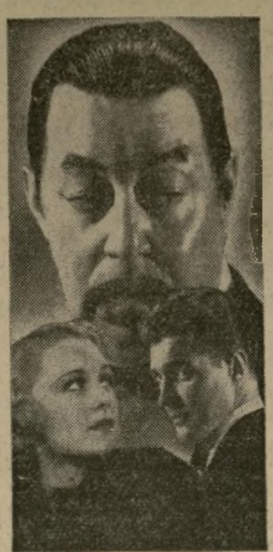
Warner Oland en el fondo y Virginia Field y Sidney Blackmer.