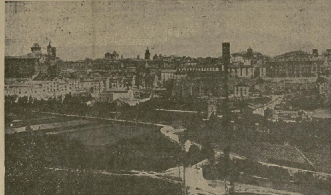
Vista general de Teruel, base del saliente con que los rebeldes amenazaban las comunicaciones entre Madrid y la costa y que las tropas gubernamentales empezaron a ocupar ayer después de una sensacional e inesperada ofensiva bábilmente dirigida por el general Pozas.