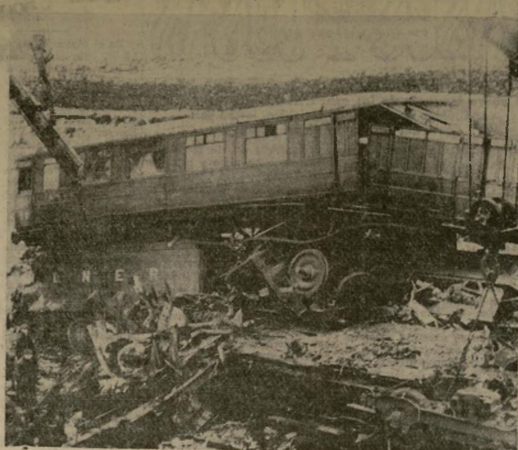
Escena en Castlecary, Escocia, en la cual se ven los carros volcados después de que el expreso de Edinburgo a Glasgow, el cual iba a una velocidad de 60 millas por hora en medio de una nieve que cegaba, se estrelló contra un tren local que estaba parado. Treinta y cuatro personas fueron muertas y noventa heridas. Este fue el peor desastre ferroviario en la Gran Bretaña en los últimos 22 años.