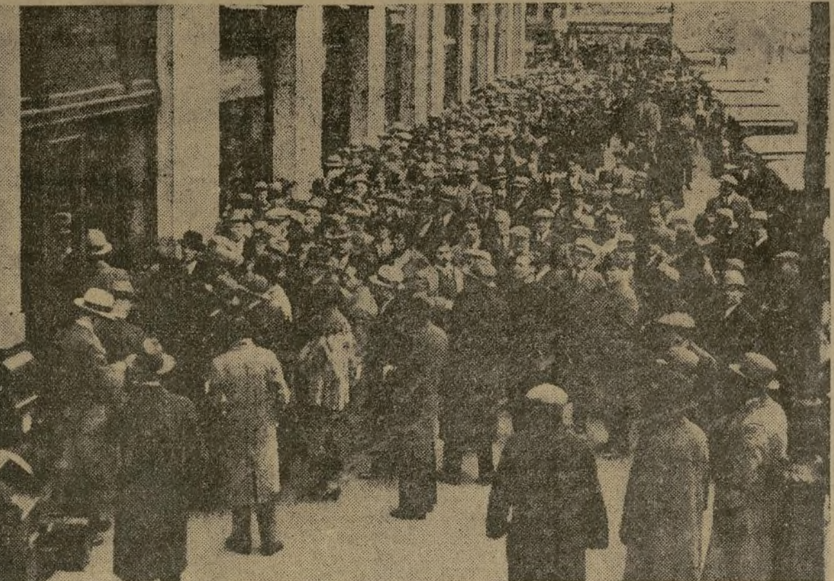
La oficina del “Department of Health”, 139 de la calle Canal, ofrecía ayer este aspecto de asedio por centenares de solicitantes de permiso para vender cerveza hoy.

LA RACHA DE ASPIRANTES A EXPENDEDORES DE CERVEZA