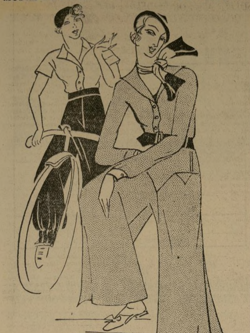
Dos modelos atractivos para ciclistas.

La agitación de la vida actual hace que la mujer moderna busque todos los medios para conservar su figura ágil y juvenil. Las dietas solas no son suficientes para ello y recurren a los ejercicios físicos y deportes. Entre todos, uno de los más populares es el ciclismo.