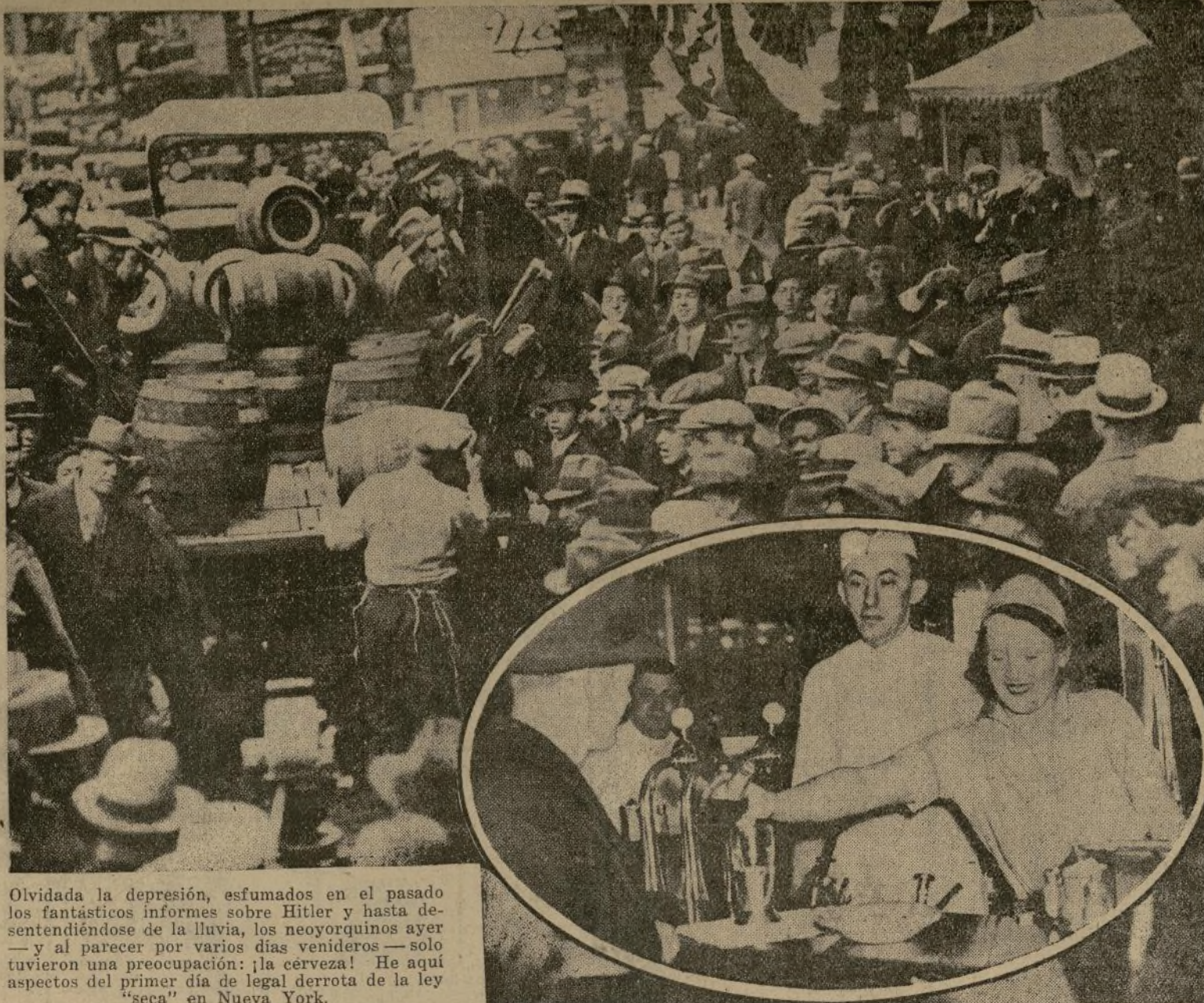
Olvidada la depresión, esfumados en el pasado los fantásticos informes sobre Hitler y hasta desentendiéndose de la lluvia, los neoyorquinos ayer —y al parecer por varios días venideros— solo tuvieron una preocupación: ¡la cerveza! He aquí aspectos del primer día de legal derrota de la ley "seca" en Nueva York.

Historia distinta Ante los jurados y el público y en medio de gran tensión, manifestó una historia completamente distinta a la que había dicho hace dos años en Scottsboro en el primer