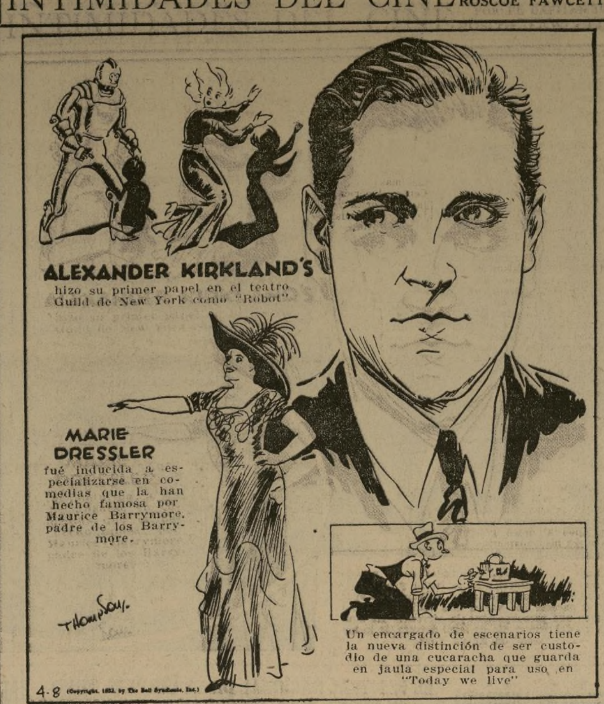
ALEXANDER KIRKLAND'S hizo su primer papel en el teatro Guild of New York como "Robot"

MARIE DRESSLER fué inducida a especializarse en comedias que la han hecho famosa por Maurice Barrymore, padre de los Barrymore.