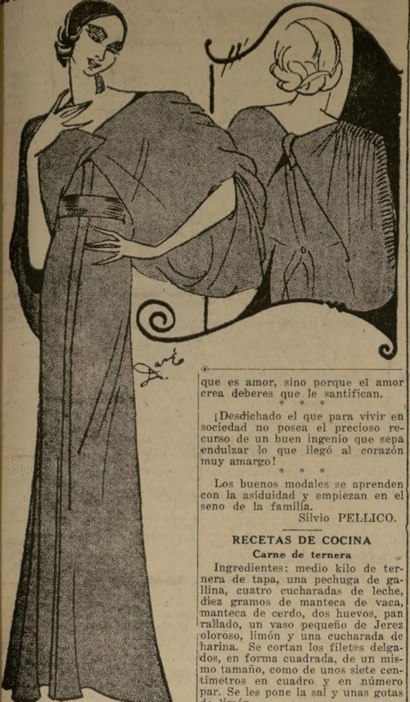
Lindísimo traje para noche.

Por BEATRIZ SANDOVAL MODAS DE PARIS Por Mlle. DARE