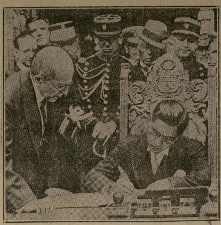
El presidente Luis M. Sánchez Cerro, firmando en Lima la nueva Constitución del país en la cual el Parlamento de dicha nación ha venido trabajando desde hace 16 meses. El ejecutivo aparece rodeado en el acto de la firma por varios de sus ministros y ayudantes militares.