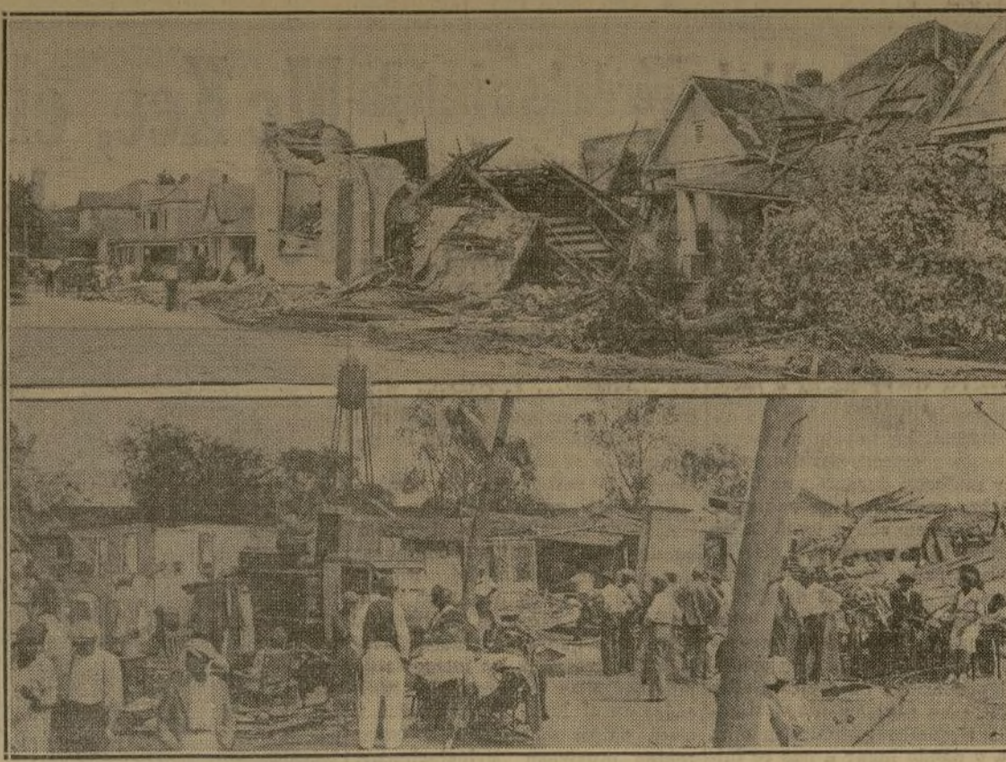
Estas fotografías ilustran de manera patética los destrozos causados por el reciente huracán que azotó a Yazoo City, en Mississippi, causando numerosas muertes y un sin fin de casas destruidas.