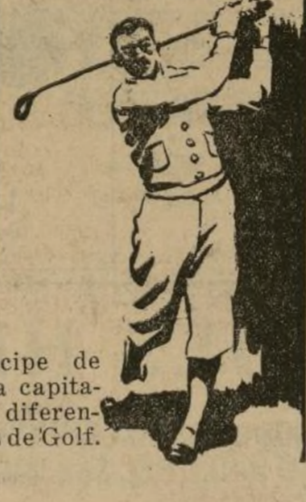
El Príncipe de Gales ha capitaneado 4 diferentes clubs de Golf.

Después de boxear y luchar todo el día, Corbett corrió una milla e hizo las últimas 100 yardas ¡en 12 segundos! (1892, M. S. Garden)