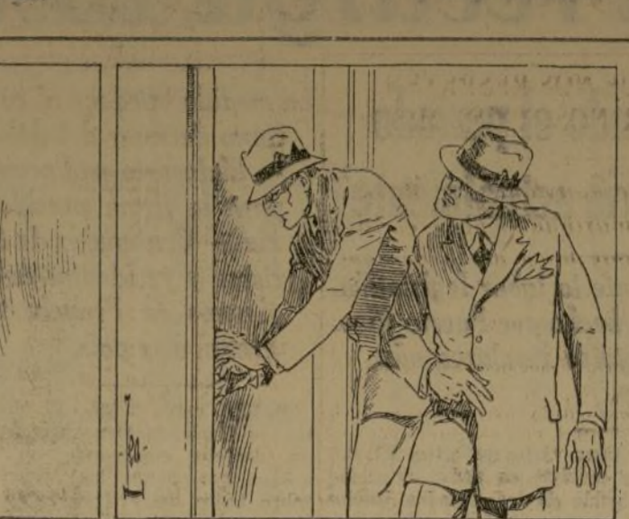
"Seguramente, Petrie", invitó en voz alta; "Weymouth nos espera en Scotland Yard". Se puso el sombrero y apenas si me dió tiempo a hacer lo mismo, arastrandome bruscamente con el corredor...