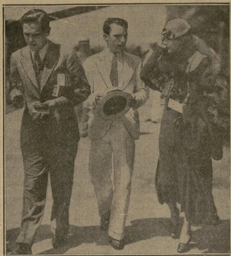
La bella y popular Ann Harding, con su novio Kirkland y un periodista habanero, días antes de embarcarse en la excursión marítima que terminó trágicamente en Punta Brava, con la muerte del marinero cubano.