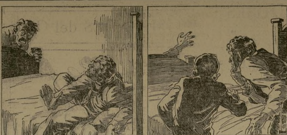
Me fui alejando más y más de aquel horror, hasta que me recogí como una pelota junto a la cacerera de la cama. Entonces, aquel ser raro y estrambótico hizo un movimiento a un lado y... ¡Dios de los Cielos...! parecía intentar dar vuelta a la cama, para acercarse a donde estaba yo temblando en espera de los acontecimientos.

Aquel ser estrambótico, aquel algo que sacudía la cama, existía, tenía vida, era algo a lo que debía temerse. Más allá de la horrible faz blanca como la cera podía ver la sala y el cofre de Tlun-Nur sobre la mesa, iluminado por la débil luz que llegaba de la calle: el cofre por el que tanto estábamos sufriendo.