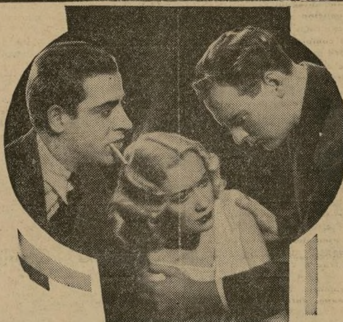
Jack La Rue, Miriam Hopkins y William Gargan en una escena de la cinta "The Story of Temple Drake", que los teatros "Hamilton" y "Regent" empiezan a exhibir el sábado próximo.