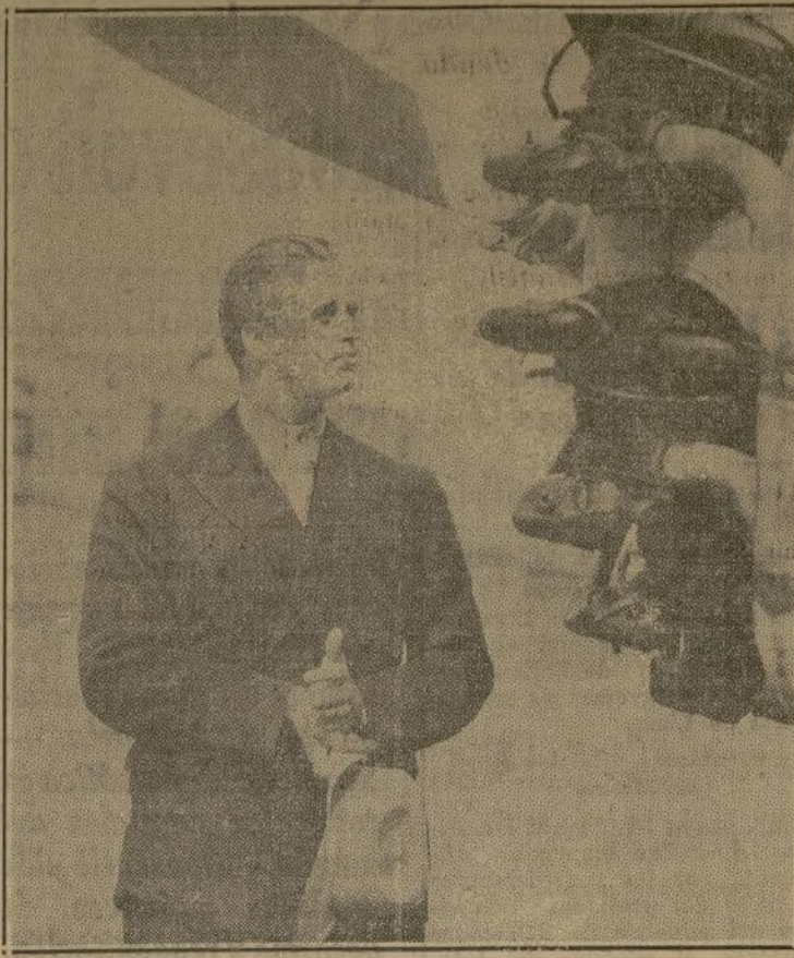
Elliott Roosevelt, segundo de los hijos del presidente, aparece aquí en su nuevo empleo de gerente de una estación de servicio de aeroplanos situada en las afueras de Los Angeles. Un amigo de la familia le dió el puesto y aquí lo tienen ustedes examinando una de las máquinas a que la empresa ha de servir.