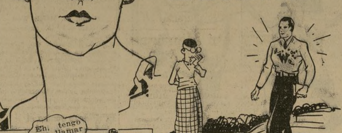
FREDRIC MARCH fue estudiante de honor, figura principal en el atletismo, miembro de 2 fraternidades, galán joven en representaciones teatrales en la escuela y presidente de la clase, en Wisconsin.