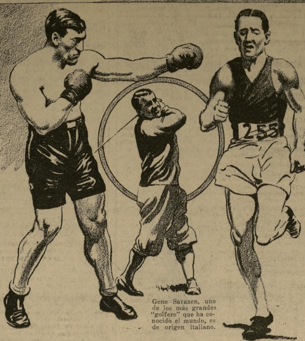
Primo Carnera tiene "órdenes" de Italia de volver a esa con el campeonato mundial "heavyweight".