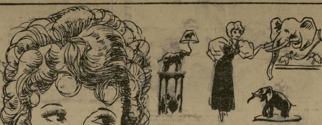
BETTY COMPSON colecciona elefantes por capricho. Posee más de 1,000 en su hogar.