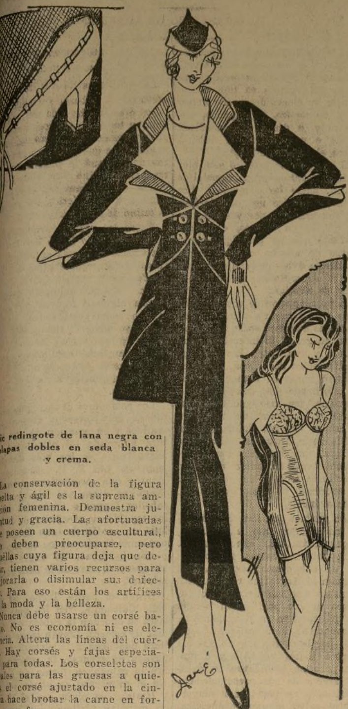
redingote de lana negra con solapas dobles en seda blanca y crema.

La conservación de la figura bella y ágil es la suprema ambición femenina. Demuestra juventud y gracia. Las afortunadas poseen un cuerpo esculpido, no deben preocuparse, pero aquellas cuya figura deja que desear, tienen varios recursos para mejorarla o disimular sus defectos. Para eso están los artifices de la moda y la belleza.