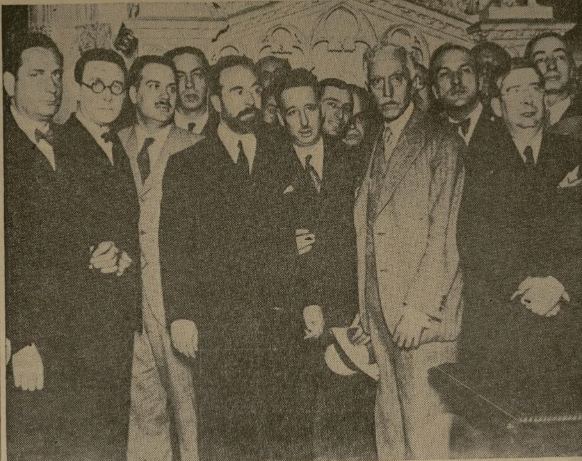
El Sr. Maciá y sus lugartenientes de la Esquerria, con los ministros de la República, de los Rios, Domingo y Nicolau d'Oliver, en Barcelona, días después de proclamada la República.