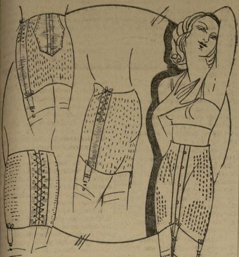
Modelos de fajas de goma perforadas

Muchas mujeres se han comido fajas de goma para reducir el volumen de las caderas y, entre, con frecuencia han quedado muy disgustadas del resultado. Sin embargo, no ha sido culpa de la faja, sino falta de preparación de quien la compró. Estas fajas producen transpiración, pero esto sólo no produce la reducción. Esta la causa la oxidación. La suave presión de la faja con el movimiento produce masaje y transpiración, y cuando firmeza a los músculos haciendo desaparecer la flacidez de las caderas y la grasa excesiva. Para lograr este beneficio es necesario que la faja cumpla las condiciones necesarias. Es muy pequeña o se usa muy poco, sólo produce transpiración, pero no es suficiente.