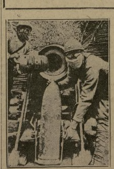
Una escena de la estupenda cinta histórica y verídica "The Big Drive", que empieza hoy en el "Loew" de la calle 116.