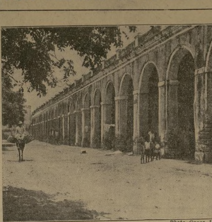
CARTAGENA, COLOMBIA.

Una de las ciudades más interesantes del hemisferio occidental es Cartagena en la República de Colombia, que alardea de ser la ciudad más antigua del continente. Dicen algunos que tiene más ambiente antiguo español que muchas poblaciones castellanas.