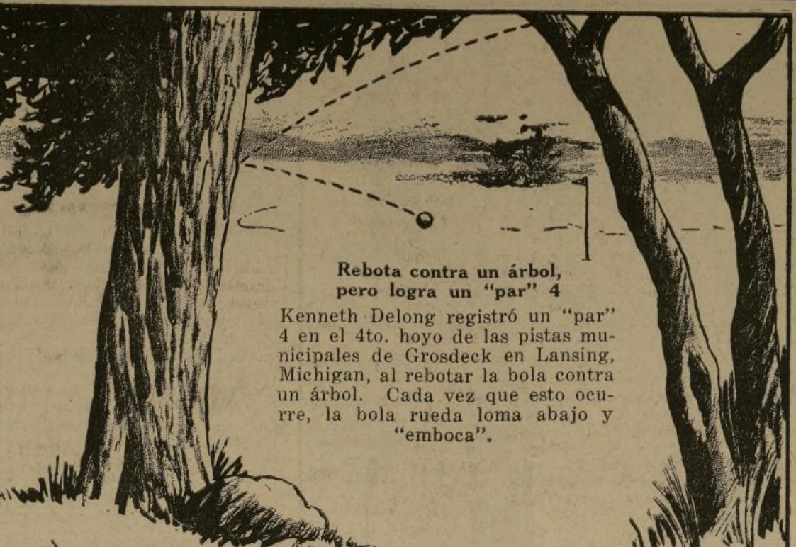
Rebota contra un árbol, pero logra un "par" 4

Por ROBERT EDGREN (Copyright by Robert Edgren)