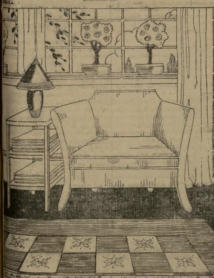
Del decorado interior

El buen gusto es sólo la expresión del sentido común. En cuestiones de decorado interior, se siguen las mismas reglas que el buen gusto dicta respecto a la decoración, pues ¿no son los muebles y cortinas los que dan a la casa? Así como no llevan zapatos de sport, por ejemplo, no se instala tampoco un ajuar Luis XV en una habitación, ni se colocan en un salón sin pretensiones muebles de una riqueza extraordinaria.