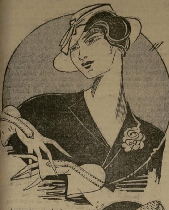
Accesorios en piqué

San resplandor encantadores lo que nos ofrece. Desde el coque, sombrerito, guantes, cinturón y toda clase de motivos de seda, sin olvidar las flores. Cualquier traje de tono claro luce más juvenil y más con motivos blancos. Los dan aires y vivacidad. Más de una vez les he visto que no es necesario ser rica para vestir bien. El bien vestir es un arte que se adquiere estudiando el buen gusto y discreción, buscando siempre armonía en el conjunto, sin recurrir jamás a adornos llamativos para hacer notar. Elegancia es sinónimo de sencillez.