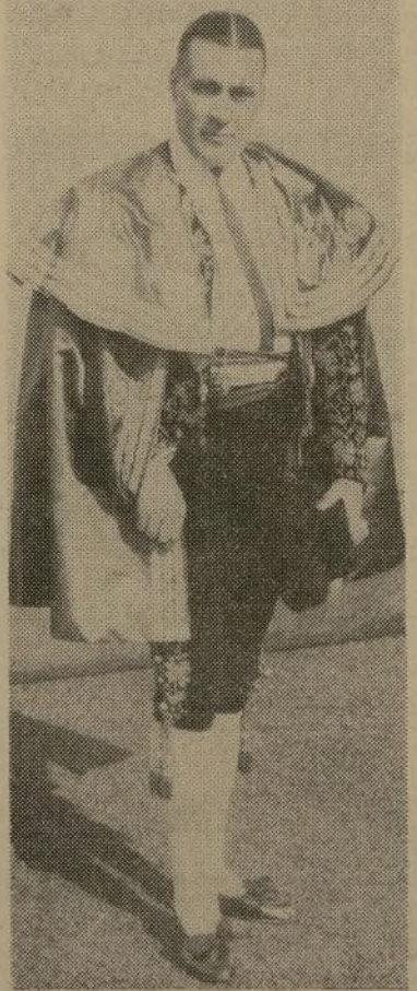
El picador español "Chicorrito"

El celebrado picador español conocido por "Chicorrito", tomará parte prominente en "Una Fiesta en Sevilla", que se inaugura el domingo próximo, día dieciocho,