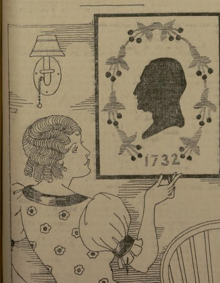
Labores de aguja

Los labores de aguja han tenido un sorprendente resurgimiento. Perseguen por un tiempo en un momento casi absoluto y han sido acrecidos de nuevo, ocupando el puesto que les pertenece entre el elemento femenino.