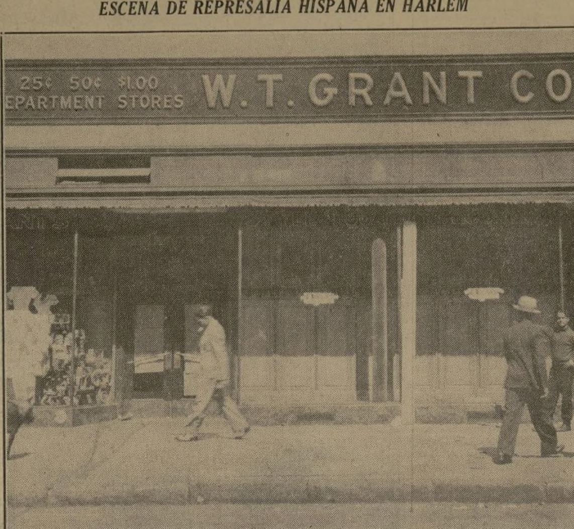
Fotografía de la vidriera quebrada a pedradas en represalia a un supuesto acto injusto contra un hispano. A la izquierda hay un agujero en el mismo centro que deja al descubierto la mercancía expuesta. En las dos vidrieras de la derecha pueden verse parches que marcan el sitio donde las pedradas dejaron sendos agujeros.