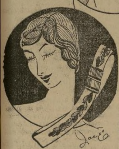
Traje de baño de goma, con gorra

Adoro los días de verano. La ardiente caricia solar produce en mis nerviosos esquileos de animación y entusiasmo y gozo en todo mi ser, o la dicha de vivir.