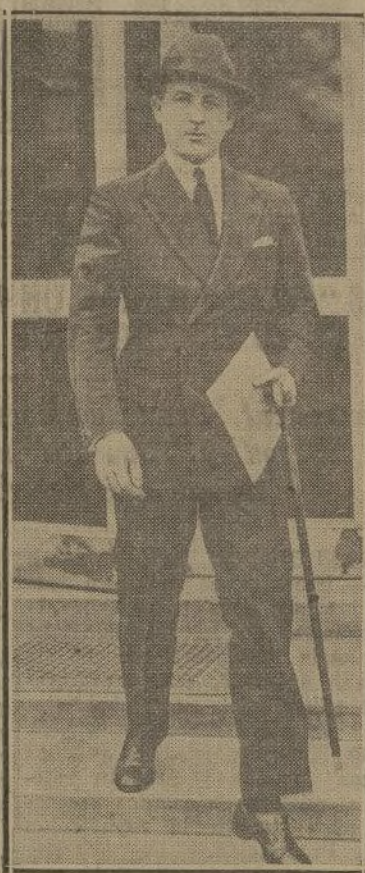
Mr. Sumner Welles

Ainciart partirá en breve para el extranjero, asegurándose que entrará en el servicio consular. Otro informe muy comentado es el de que tres automóviles pertenecientes al senador Virinto Gutiérrez, por mucho tiempo el hombre de confianza del general Machado, fueron embarcados el sábado para Europa a bordo del vapor "Orinoco".