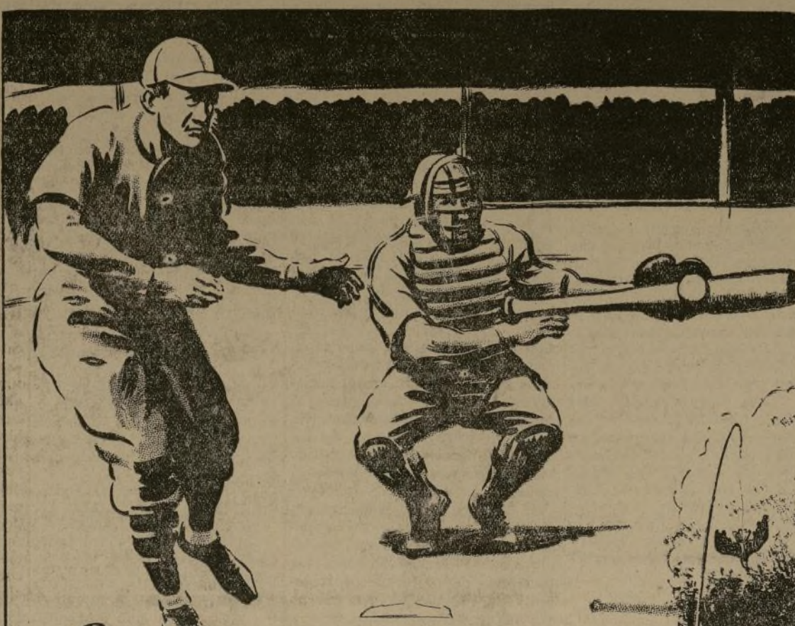
¡Un batazo singular!

Mickey Cochrane tiró su bate contra una bola que venía algo abierta y obtuvo un "hit" neto sobre primera base. (Phil. A's, 1932)