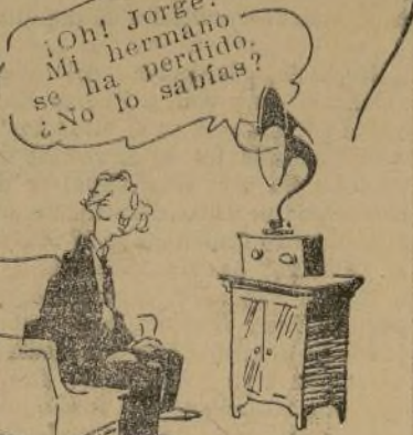
GEORGE BURNS Y GRACIE ALLEN

siempre se quita los zapatos antes de filmar una escena muy emocionante, en la cual no le han de fotografiar los pies.