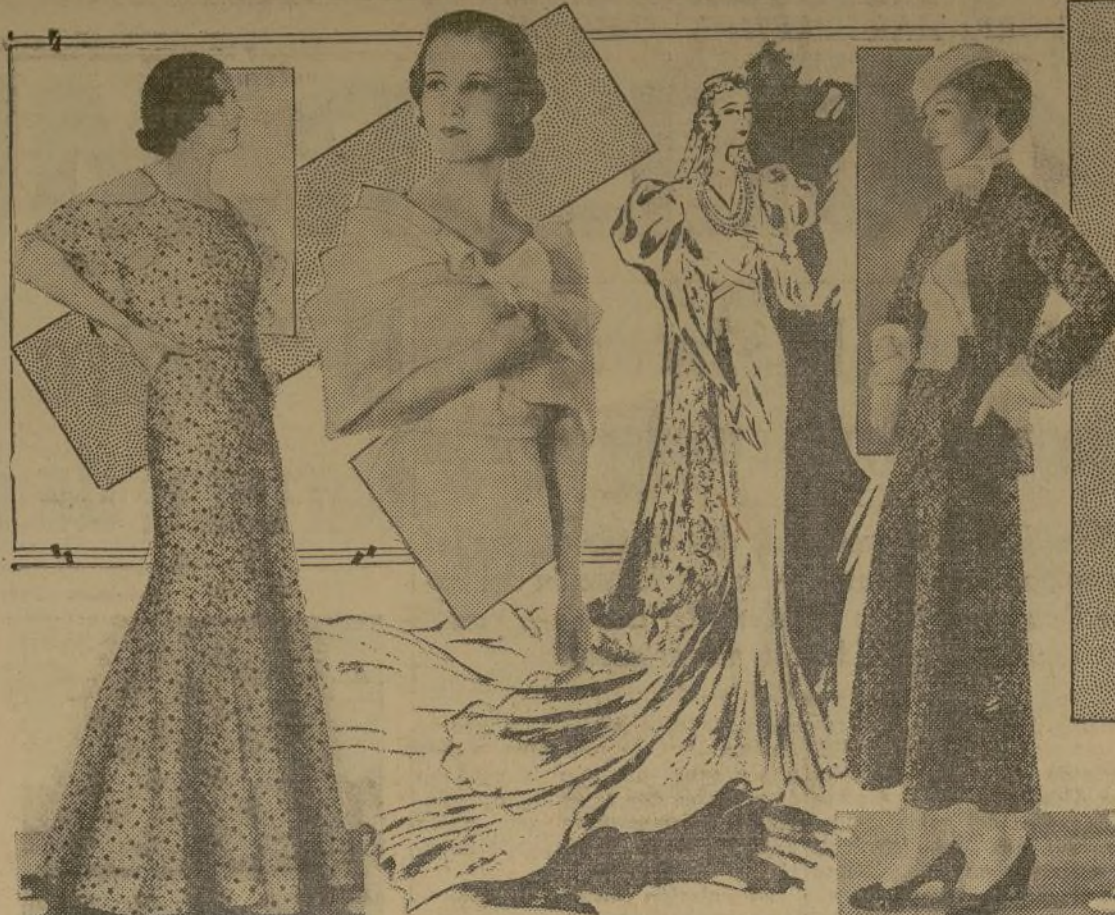
Ha aquí tres de los modelos exclusivos de trajes de Barbara Hutton, heredera de los millones de Woolworth, compró a uno de los más afamados modistos de París para su reciente casamiento con el príncipe ruso Alejo Mdivani y que han costado un dínaral. El dibujo representa el traje que usó para la ceremonia religiosa.