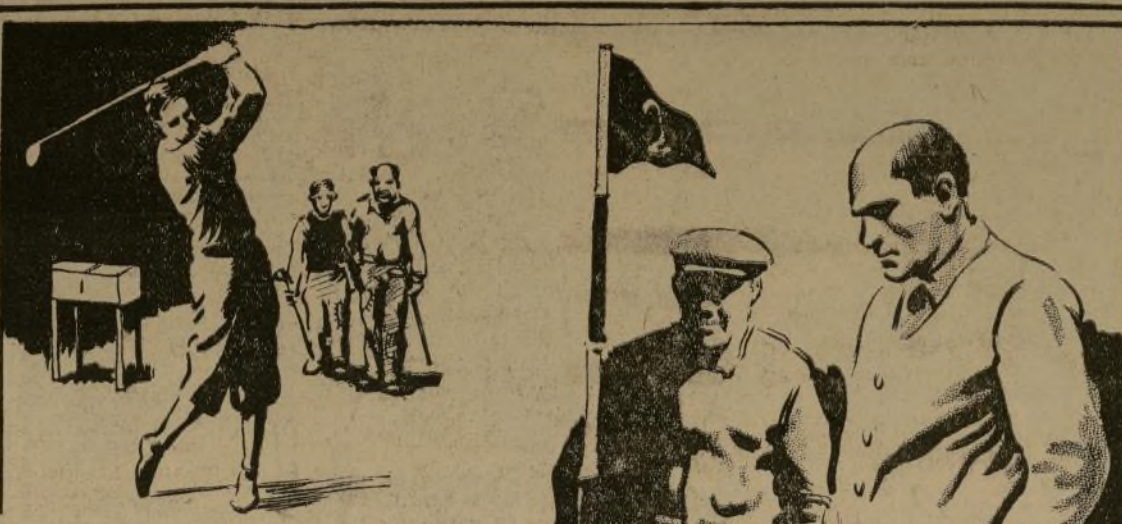
La ciudad de Syracuse, N. Y., proporciona gratuitamente terrenos de Golf a los cesantes.