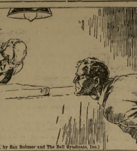
Allí nos encontramos Sir Baldwin y yo, víctimas de su astucia y su maldad, y en tanto él se paseaba del uno al otro lado con aburrimiento...