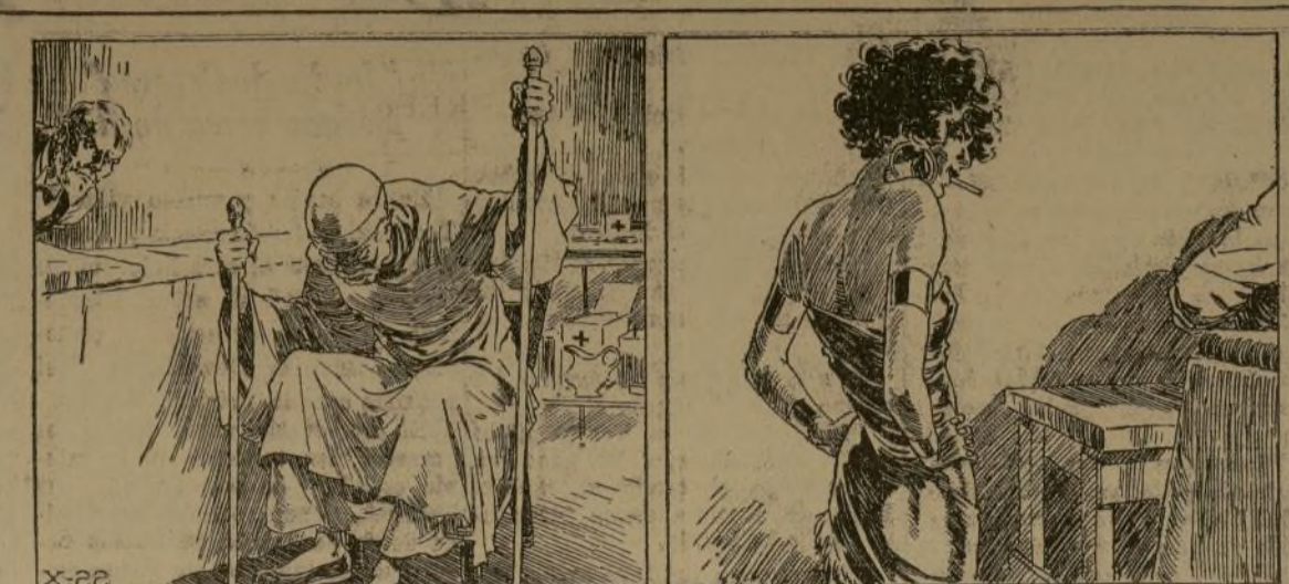
La venta que con Fu Manchú se envolvía la cabeza hacia el cráneo del anciano más alargado y raro...