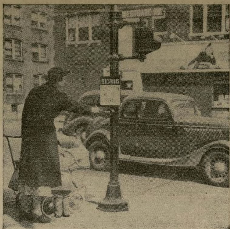
Apretando un botón en un poste de semáforo en una esquina de St. Louis, una madre pone luz roja para tener derecho de vía. Semáforos de esta clase existen en intersecciones en donde el tráfico no justifica la instalación de los semáforos usuales.