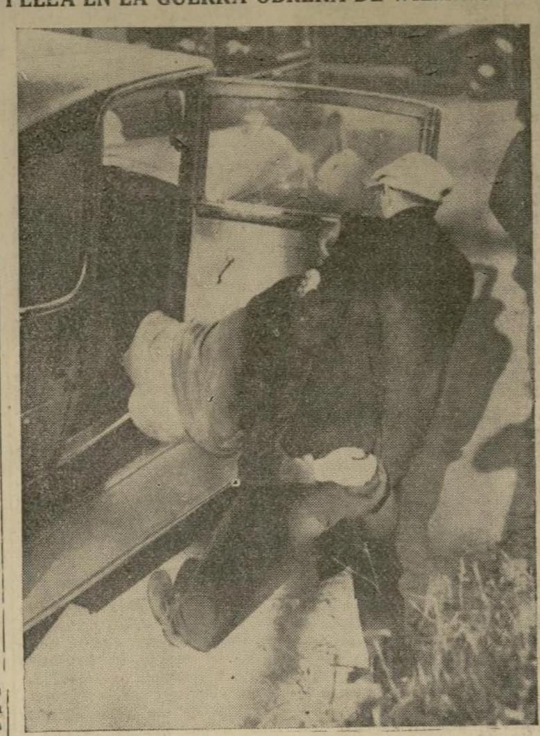
Un huelguista saca a un rompe-huelgas de su automóvil en los disturbios que tuvieron lugar durante la huelga general que fué declarada por 39 uniones, la cual paralizó toda la industria en la ciudad de Delaware por varias horas. Una tregua fué lograda por el gobernador McMullen, el conciliador federal E. C. McDonald y el alcalde Bacon.