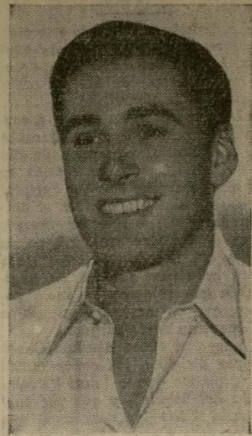
Errol Flynn que entró en España el día 27 de marzo y del que se dijo había sido herido en la cara, cuando visitaba el frente de la Ciudad Universitaria, parece que goza de buena salud. Se ha desmentido el accidente.