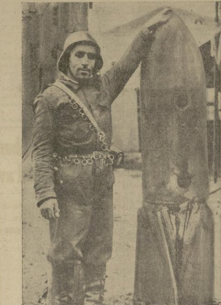
Una de las muchas bombas de 400 libras arrojada por los aviadores del general Franco en las líneas leales, ha sido conservada como "recurso" por milicianos del gobierno.