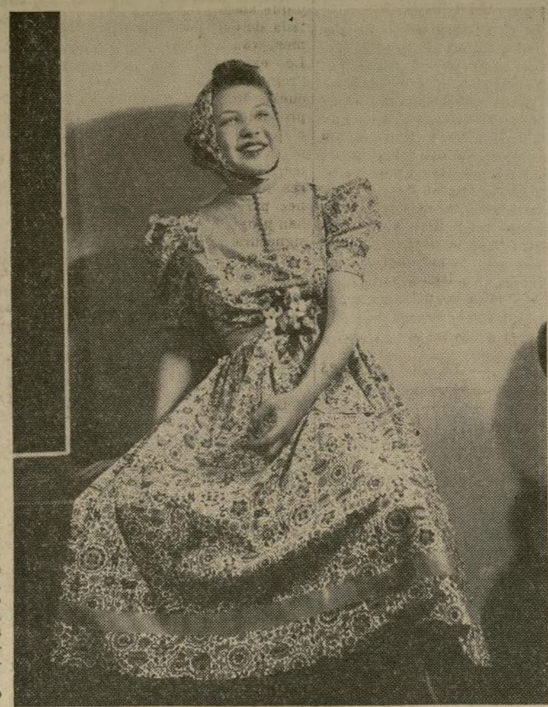
Uno de los vestidos de inspiración húngara que se muestra en Franklin Simons.

Por INES (NO DEJE QUE LA MODA LE USE—USE LA MODA)