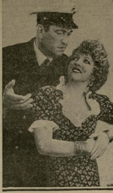
He aquí una escena de la película "Sea Devils" que presenta al Teatro Regent desde hoy. Aparece aquí Víctor McLaglen en un momento de romanticismo, haciendo el amor a la tatarabuela de vez en cuando le regalaba con parte de sus ganancias.