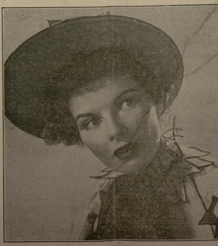
Katharine Hepburn, estrella dramática del cinematógrafo, que toma parte principal en la película "Quality Street" que empieza a presentar hoy el Radio City Music Hall.